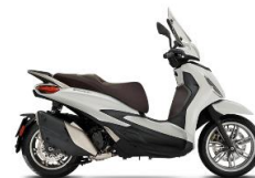
Beverly 400 ABS-ASR