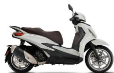
Beverly 300 ABS-ASR