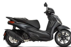
Beverly 300 S ABS-ASR